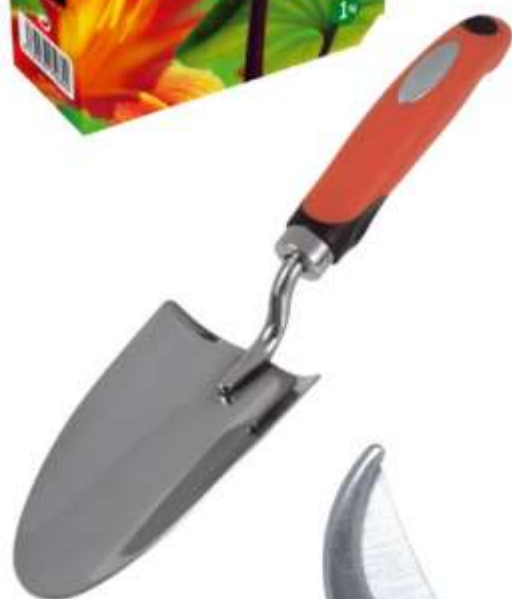
Abonos, herramientas y accesorios de riego forman parte de la oferta de Plantia Garden.